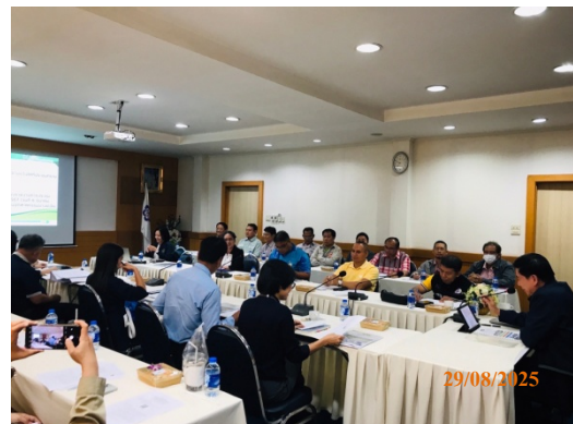
รูปที่ 25 การจัดประชุมพหุภาคี

รูปที่ 3.1-1 ภาพถ่ายแสดงการปฏิบัติตามมาตรการป้องกันและแก้ไขผลกระทบสิ่งแวดล้อม โรงไฟฟ้าพลังความร้อนร่วมบางปะอิน บริษัท บางปะอิน โคเจนเนอเรชั่น จำกัด (ต่อ)