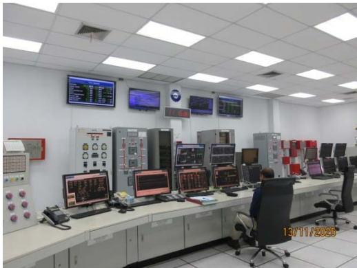
รูปที่ 31 ห้อง Control Room