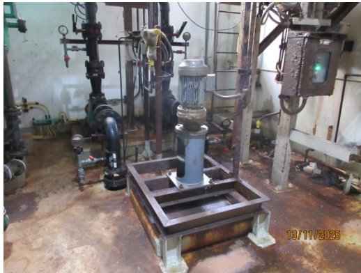
รูปที่ 9 ถังปรับสภาพน้ำเสีย (Neutralization Tank)