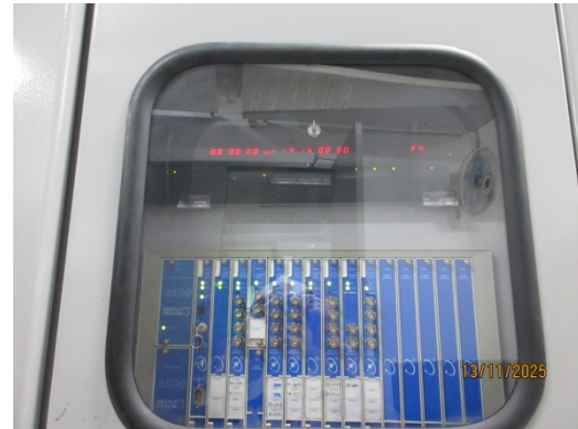
รูปที่ 44 Gas Detector บริเวณ Gas Turbine และ Gas Compressor