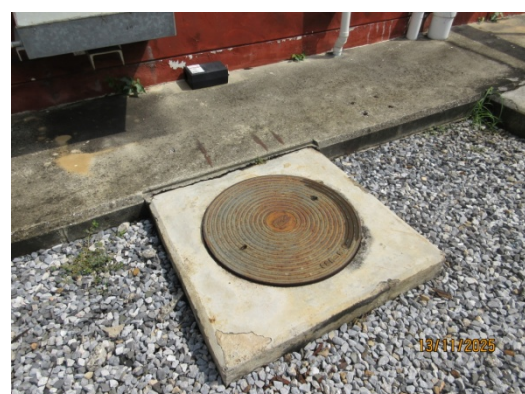
รูปที่ 8 ถังบำบัดน้ำเสียสำเร็จรูป

รูปที่ 3.1-1 ภาพถ่ายแสดงการปฏิบัติตามมาตรการป้องกันและแก้ไขผลกระทบสิ่งแวดล้อม โรงไฟฟ้าพลังความร้อนร่วมบางปะอิน บริษัท บางปะอิน โกลเดนเนอเรชั่น จำกัด (ต่อ)