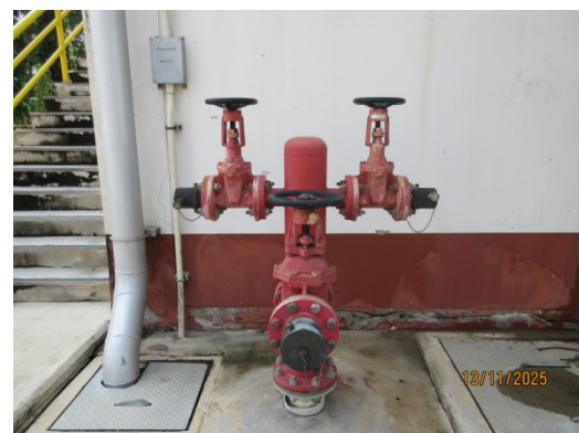
รูปที่ 48 Fire Hydrant

รูปที่ 3.1-1 ภาพถ่ายแสดงการปฏิบัติตามมาตรการป้องกันและแก้ไขผลกระทบสิ่งแวดล้อม โรงไฟฟ้าพลังความร้อนร่วมบางปะอิน บริษัท บางปะอิน โกลเดนเนอเรชั่น จำกัด (ต่อ)