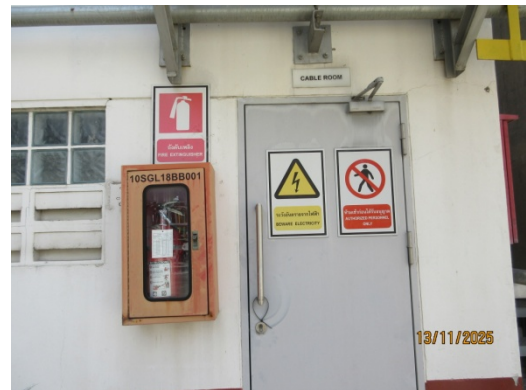
รูปที่ 52 Portable fire extinguishers