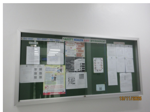
รูปที่ 42 ป้ายประชาสัมพันธ์ข้อมูลข่าวสาร เกี่ยวกับความปลอดภัย

รูปที่ 3.1-1 ภาพถ่ายแสดงการปฏิบัติตามมาตรการป้องกันและแก้ไขผลกระทบสิ่งแวดล้อม โรงไฟฟ้าพลังความร้อนร่วมบางปะอิน บริษัท บางปะอิน โกลเดนเนอเรนซ์ จำกัด (ต่อ)