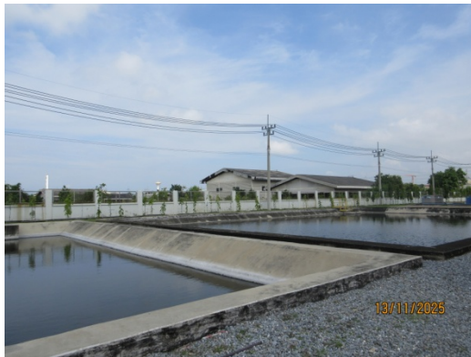
รูปที่ 11 บ่อพักน้ำทิ้งขนาด 800 ลูกบาศก์เมตร