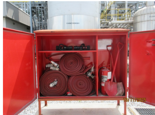
รูปที่ 46 Fire Hose Cabinet