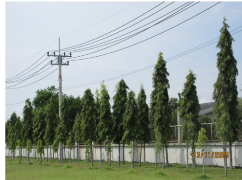
รูปที่ 6 พื้นที่สีเขียว และต้นไม้ยืนต้นเพื่อเป็นแนวกันเสียงในพื้นที่โครงการ