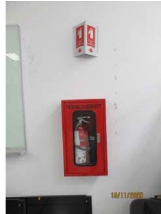
รูปที่ 38 ถังดับเพลิง