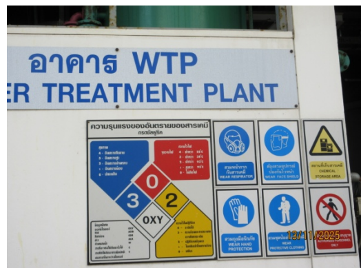
รูปที่ 53 ข้อมูลความปลอดภัยในการทำงานเกี่ยวกับสารเคมี

รูปที่ 3.1-1 ภาพถ่ายแสดงการปฏิบัติตามมาตรการป้องกันและแก้ไขผลกระทบสิ่งแวดล้อม โรงไฟฟ้าพลังความร้อนร่วมบางปะอิน บริษัท บางปะอิน โกลเดนเนอเรชั่น จำกัด (ต่อ)