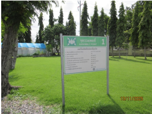
รูปที่ 37 จุฬารวมพล