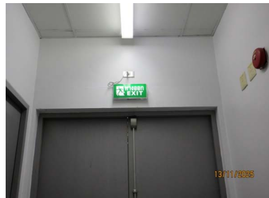
รูปที่ 36 ทางออกฉุกเฉิน

รูปที่ 3.1-1 ภาพถ่ายแสดงการปฏิบัติตามมาตรการป้องกันและแก้ไขผลกระทบสิ่งแวดล้อม โรงไฟฟ้าพลังความร้อนร่วมบางปะอิน บริษัท บางปะอิน โกลเดนเนอเรชั่น จำกัด (ต่อ)