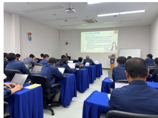
รูปที่ 28 การอบรมด้านอาชีวอนามัยและ ความปลอดภัยในการทำงาน