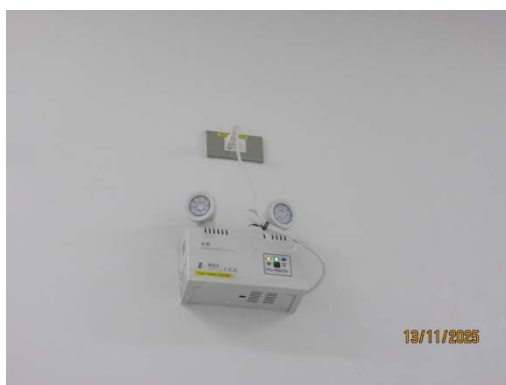
รูปที่ 35 Emergency Light System