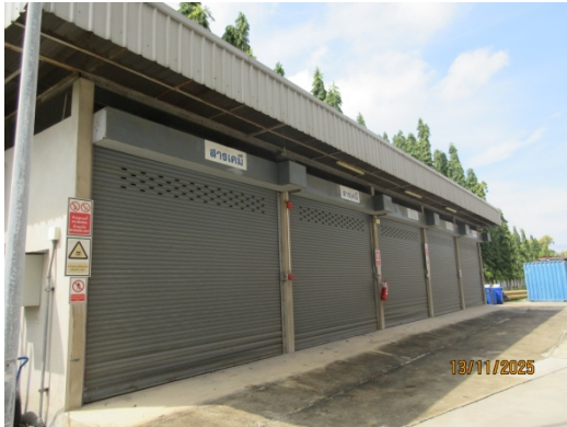
รูปที่ 20 อาคารเก็บของเสีย