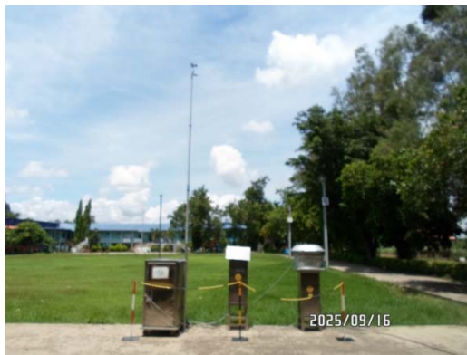
รูปที่ 27 การตรวจวัดคุณภาพอากาศในบรรยากาศ