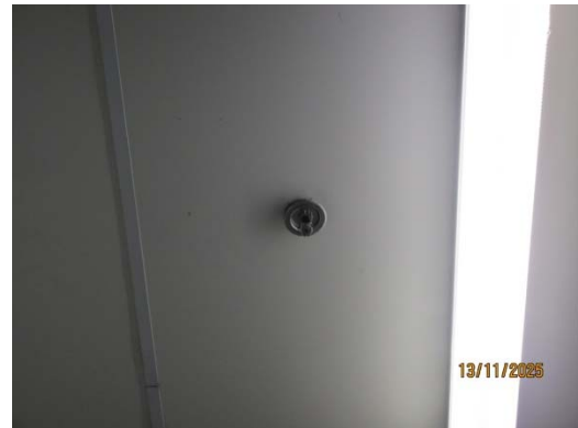
รูปที่ 34 Sprinkler System