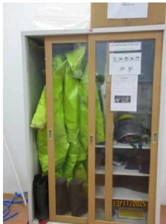
รูปที่ 39 อุปกรณ์ป้องกันอันตรายส่วนบุคคล จากสารเคมี