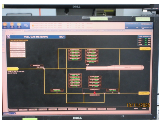
รูปที่ 56 ระบบ SCADA