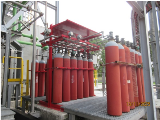
รูปที่ 45 ระบบดับเพลิงแบบใช้ CO 2