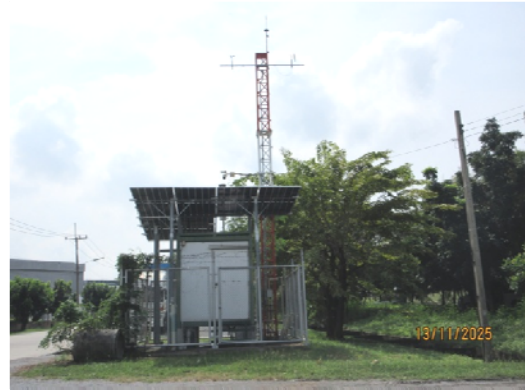
รูปที่ 2 การติดตั้งสถานีตรวจวัดคุณภาพอากาศ แบบอัตโนมัติ (AQMS)