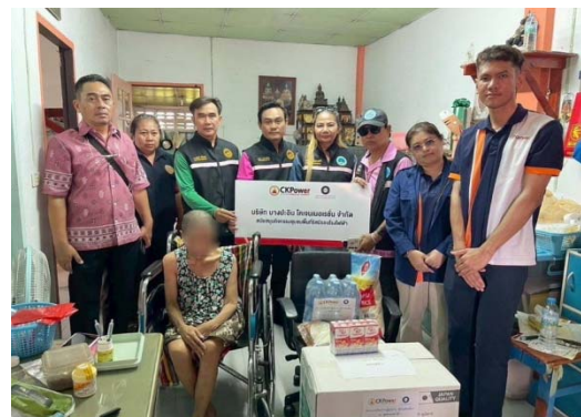
รูปที่ 23 การเข้าร่วมกิจกรรมต่างๆ กับชุมชน

รูปที่ 3.1-1 ภาพถ่ายแสดงการปฏิบัติตามมาตรการป้องกันและแก้ไขผลกระทบสิ่งแวดล้อม โรงไฟฟ้าพลังความร้อนร่วมบางปะอิน บริษัท บางปะอิน โกลเดนเนอเธอร์แลนด์ จำกัด (ต่อ)