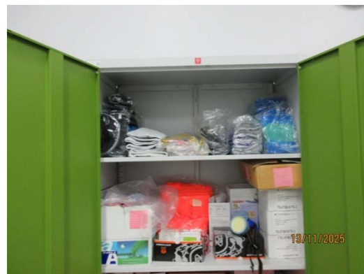
รูปที่ 5 อุปกรณ์ป้องกันอันตรายส่วนบุคคล

รูปที่ 3.1-1 ภาพถ่ายแสดงการปฏิบัติตามมาตรการป้องกันและแก้ไขผลกระทบสิ่งแวดล้อม โรงไฟฟ้าพลังความร้อนร่วมบางปะอิน บริษัท บางปะอิน โกลเดนเนอเรชั่น จำกัด