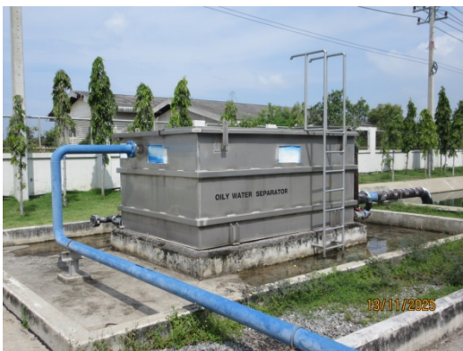
รูปที่ 13 ถังแยกน้ำ-น้ำมัน (Oil Separator)