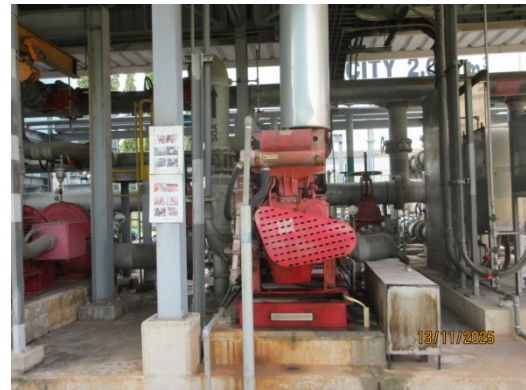
รูปที่ 50 ระบบน้ำดับเพลิงที่ใช้เครื่องยนต์ (Fire Pump)