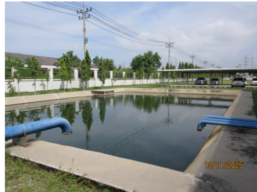
รูปที่ 10 บ่อพักน้ำทิ้งขนาด 300 ลูกบาศก์เมตร