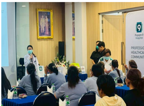
รูปที่ 58 อบรมการปฐมพยาบาลเบื้องต้นให้กับ อสม.

รูปที่ 3.1-1 ภาพถ่ายแสดงการปฏิบัติตามมาตรการป้องกันและแก้ไขผลกระทบสิ่งแวดล้อม โรงไฟฟ้าพลังความร้อนร่วมบางปะอิน บริษัท บางปะอิน โกลเดนเนอเรชั่น จำกัด (ต่อ)