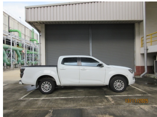
รูปที่ 40 พาหนะสำรองเพื่อใช้ในกรณีฉุกเฉิน