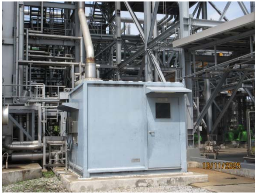
รูปที่ 1 ระบบตรวจสอบคุณภาพอากาศแบบต่อเนื่อง (CEMs)