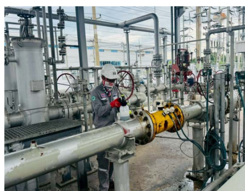
รูปที่ 57 ตรวจสอบการรั่วซึมของระบบท่อ

รูปที่ 3.1-1 ภาพถ่ายแสดงการปฏิบัติตามมาตรการป้องกันและแก้ไขผลกระทบสิ่งแวดล้อม โรงไฟฟ้าพลังความร้อนร่วมบางปะอิน บริษัท บางปะอิน โกลเดนเนอเรชั่น จำกัด (ต่อ)