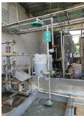
รูปที่ 54 อ่างล้างตาฉุกเฉิน และฝักบัวชำระล้างร่างกาย