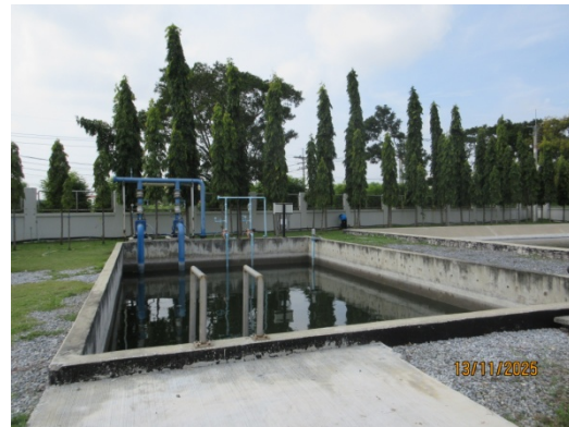
รูปที่ 12 บ่อพักน้ำทิ้งขนาด 100 ลูกบาศก์เมตร