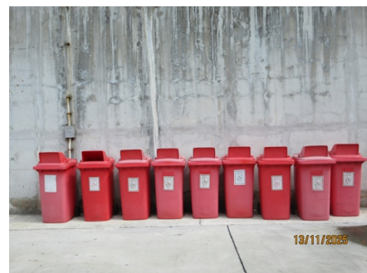
รูปที่ 19 ถังรองรับขยะมูลฝอย ขยะมูลฝอยรีไซเคิล และขยะอันตราย

รูปที่ 3.1-1 ภาพถ่ายแสดงการปฏิบัติตามมาตรการป้องกันและแก้ไขผลกระทบสิ่งแวดล้อม โรงไฟฟ้าพลังความร้อนร่วมบางปะอิน บริษัท บางปะอิน โกลเดนเนอเรชั่น จำกัด (ต่อ)