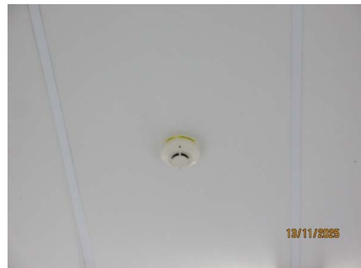
รูปที่ 32 Smoke Detectors