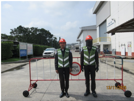
รูปที่ 22 เจ้าหน้าที่ดูแลการจราจรบริเวณทางเข้า-ออกพื้นที่โครงการ