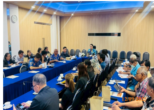
รูปที่ 24 ชุมชนเข้ารับฟังการรายงานผลการปฏิบัติตามมาตรการฯ