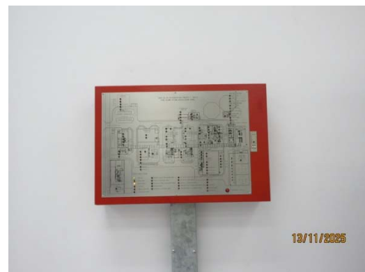
รูปที่ 30 Fire Alarm System

รูปที่ 3.1-1 ภาพถ่ายแสดงการปฏิบัติตามมาตรการป้องกันและแก้ไขผลกระทบสิ่งแวดล้อม โรงไฟฟ้าพลังความร้อนร่วมบางปะอิน บริษัท บางปะอิน โกลเดนเนอเรชั่น จำกัด (ต่อ)