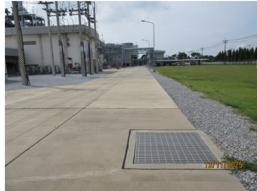
รูปที่ 16 รางระบายน้ำฝนภายในพื้นที่โครงการ