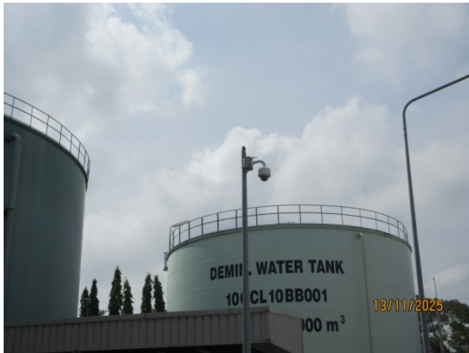
รูปที่ 43 ถังบรรจุขจัดบริเวณจุดสำคัญต่างๆ ภายในโครงการ