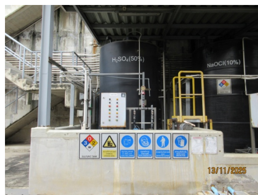
รูปที่ 55 กังพองคอนกรีตล้อมรอบถังน้ำมันและสารเคมี