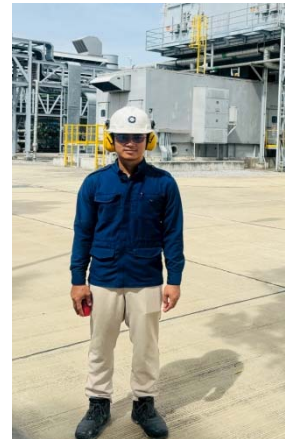
รูปที่ 4 การสวมใส่อุปกรณ์ป้องกันอันตรายส่วนบุคคล