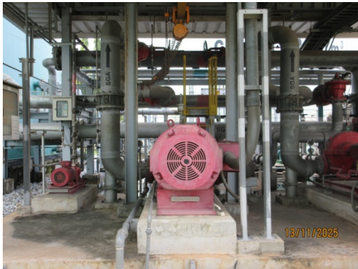
รูปที่ 49 Jockey pump