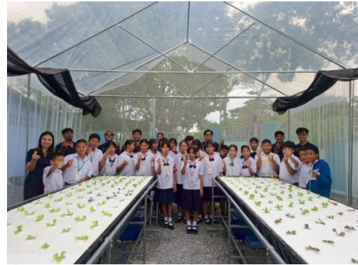
รูปที่ 23 การเข้าร่วมกิจกรรมต่างๆ กับชุมชน (ต่อ)