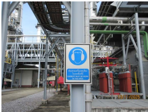
รูปที่ 3 ป้ายเตือนบริเวณที่มีระดับเสียงดัง