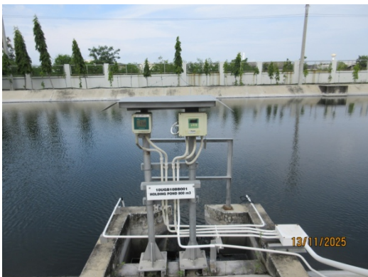
รูปที่ 17 ระบบตรวจวัดน้ำทิ้งแบบอัตโนมัติ (pH meter, Temperature)