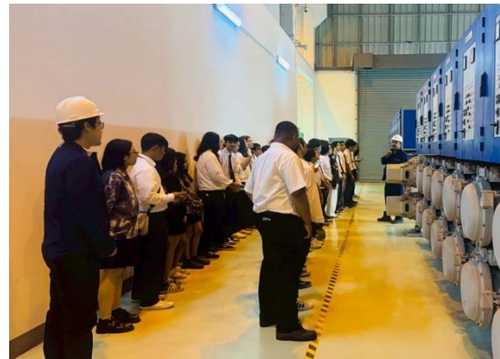
รูปที่ 26 การเข้าเยี่ยมชมภายในโครงการ