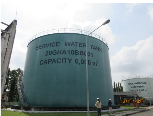
รูปที่ 47 ถังเก็บกักน้ำประปาขนาด 6,000 ลูกบาศก์เมตร