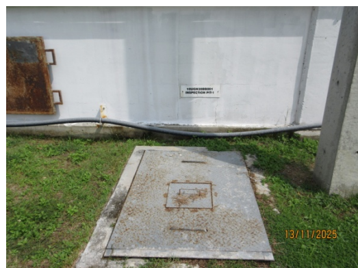
รูปที่ 14 Inspection Manhole 1

รูปที่ 3.1-1 ภาพถ่ายแสดงการปฏิบัติตามมาตรการป้องกันและแก้ไขผลกระทบสิ่งแวดล้อม โรงไฟฟ้าพลังความร้อนร่วมบางปะอิน บริษัท บางปะอิน โกลเดนเนอเรชั่น จำกัด (ต่อ)