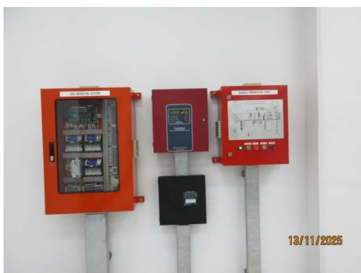
รูปที่ 29 Gas Detector System