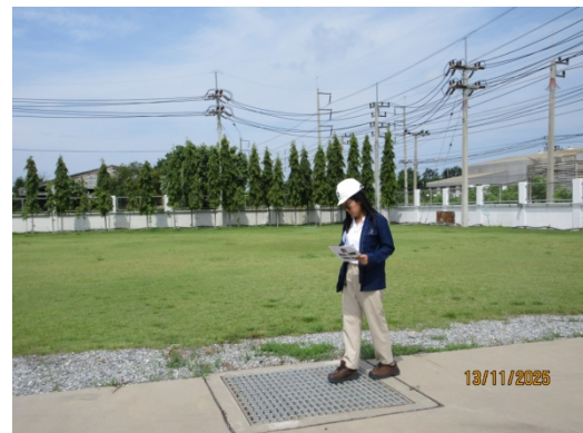
รูปที่ 18 การเดินตรวจรางระบายน้ำฝน