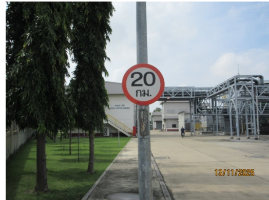
รูปที่ 21 ป้ายจำกัดความเร็วในพื้นที่โครงการ