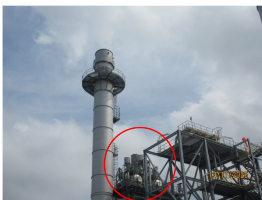
รูปที่ 7 Silencer บริเวณวาล์วท่อระบายน้ำ