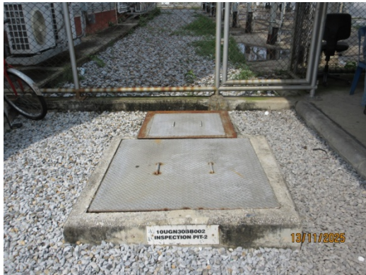
รูปที่ 15 Inspection Manhole 2