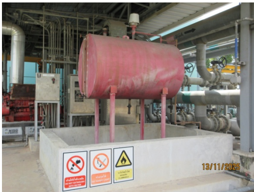
รูปที่ 51 ถังเก็บน้ำมันดีเซล สำหรับจ่ายให้กับ Fire Pump