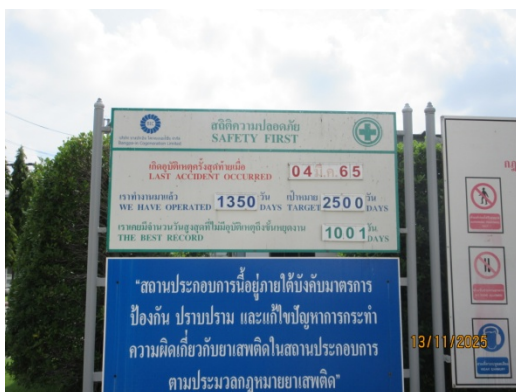
รูปที่ 41 ป้ายสถิติความปลอดภัย และอุบัติเหตุ